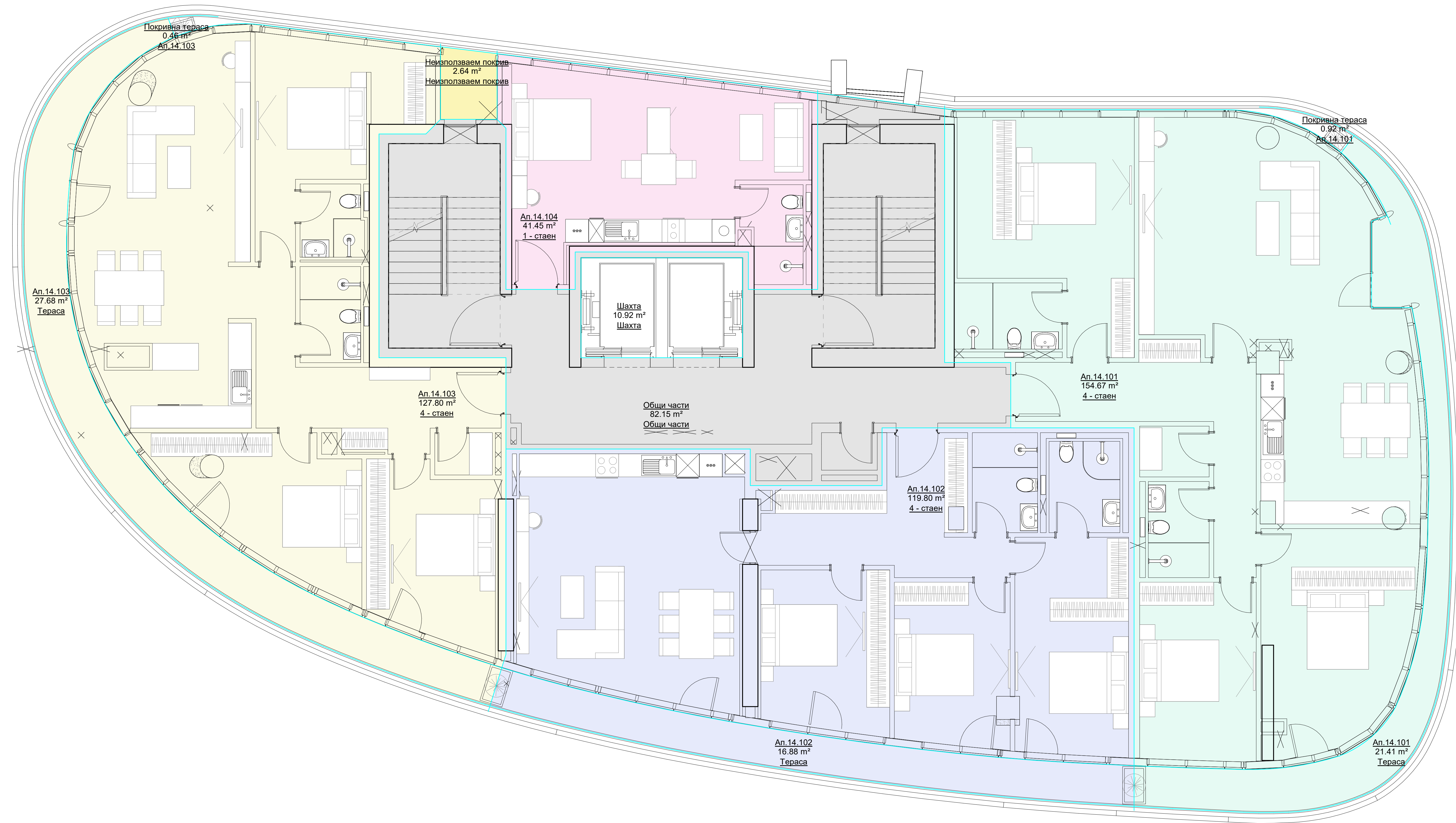
СХЕМА НА ПЛОЩООБРАЗУВАНЕ